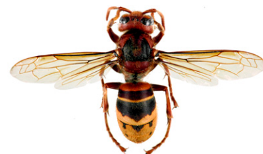
Europese hoornaar, Vespa crabro

The Oosterse hoornaar , Vespa orientalis , is even groot als de Europese hoornaar. De hoornaar is helemaal rood, behalve het gele aangezicht en een gele band op de punt van het achterlijf. Deze hoornaar is alleen aanwezig in zuidoost Europa (zuid Italië, Malta, Cyprus, Roemenië, Bulgarije).