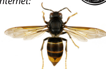
Geelpotige/Aziatische hoornaar, Vespa velutina

The Europese hoornaar , Vespa crabro , heeft een voornamelijk felgeel achterlijf, met zwarte banden. De kop is geel van voren gezien, en roodachtig van boven. Borststuk en poten zijn zwart en roodbruin. Werksters meten tussen 18 en 23mm en koninginnen tussen 25 en 35mm.