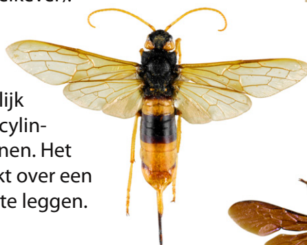
Reuzenhoutwesp, Urocerus gigas

The Reuzenhoutwesp , Urocerus gigas , is een houtwesp waarvan de larven hout eten. Deze zwart en geel gebandeerde 'wesp' kan gemakkelijk worden onderscheiden van hoornaars door het cilindrische lichaam en de lange volledig gele antennen. Het vrouwtje kan wel 45mm lang worden en beschikt over een lange legboor om haar eieren in boomstronken te leggen. Deze soort is volledig ongevaarlijk.