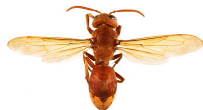
Oosterse hoornaar, Vespa orientalis

Wespen zijn kleiner dan hoornaars. De werksters zijn ongeveer 15mm in de zomer. Let op: een wespenkoningin kan net boven de 20mm zijn, dat is ongeveer even groot als de Aziatische hoornaar, maar dan zonder kop. Daardoor kunnen in het voorjaar koninginnen van wespen groter zijn dan de eerste vliegende hoornaar werksters.