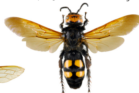
Megascolia wesp, Megascolia maculata

Megascolia wesp , Megascolia maculata , is een van de grootste Europese 'wespen', en wordt daarom herhaaldelijk verward met de Aziatische hoornaar. Het insect is dicht behaard en heeft een glimmend zwart achterlijf. De kop is geel van boven, en op het achterlijf zitten vier haarloze gele vlekken. Het is een parasiet van larven van grote kevers (zoals de meikever).