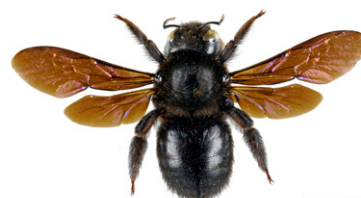
Blauwzwarte houtbij, Xylocopa violacea

The Blauwzwarte houtbij , Xylocopa violacea , meet 20-30mm; ze is volledig zwart maar reflecteert purperblauw. Het vrouwtje van deze solitaire bij bouwt haar nesten in dood hout en verzamelt stuifmeel en nectar voor haar larven.